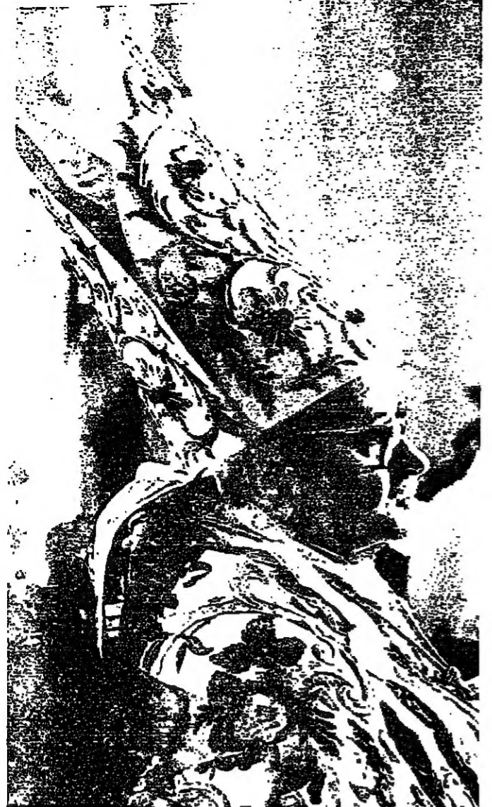
البطريك خريش في احتفال بتصيبه امس